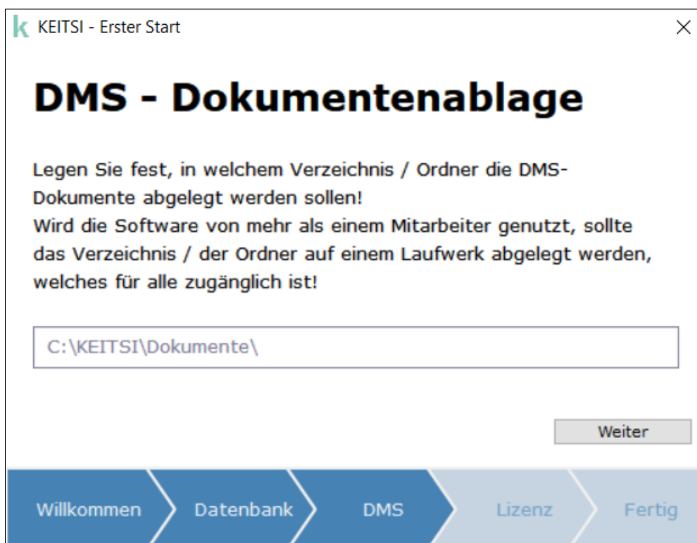
3. Schritt: Auswahl des Dokumentenverzeichnisses

Handelt es sich um eine Konfiguration auf einem weiteren Arbeitsplatz, wählen Sie bitte die entsprechend bereits verwendete Datenbankdatei aus. Informationen dazu finden Sie in den Einstellungen.