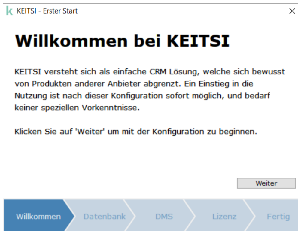
1. Schritt: Willkommen bei KEITSI

Hierbei gilt es zu beachten: Arbeiten mehrere Mitarbeiter mit der Software, muss die Datenbankdatei und das Dokumentenverzeichnis in einem Verzeichnis oder Server abgelegt werden, welches für alle Mitarbeiter zugänglich ist.